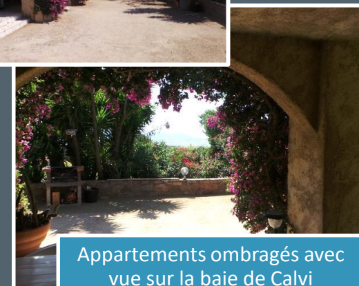
Appartements ombragés avec vue sur la baie de Calvi