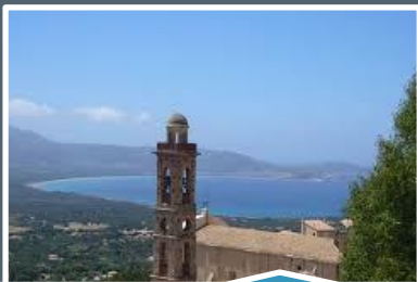
Lumio, un des plus beaux Village de Balagne