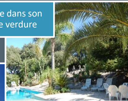
La Piscine dans son écrin de verdure

m 2 , vous pourrez profiter de la grande piscine familiale et de ses abords ombragés.