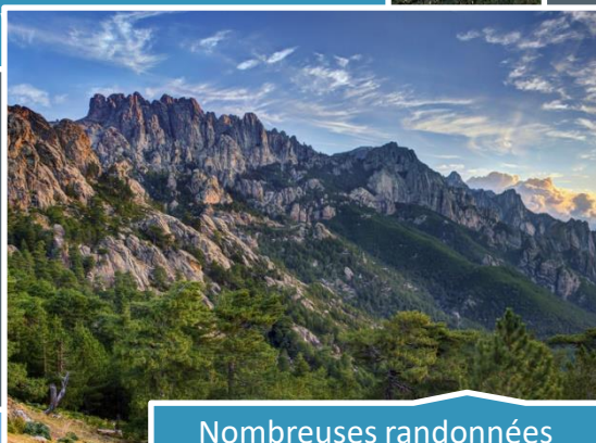
Nombreuses randonnées pédestres