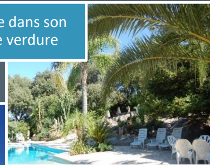
La Piscine dans son écrin de verdure

m 2 , vous pourrez profiter de la grande piscine familiale et de ses abords ombragés.